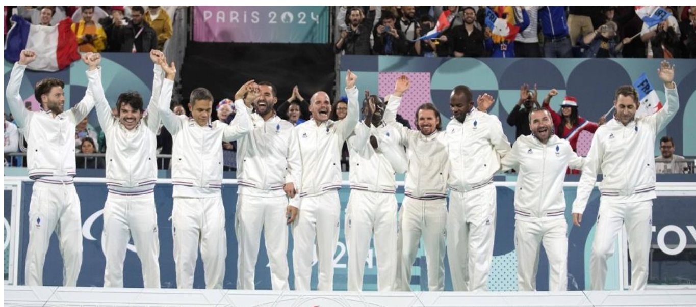
Équipe de France, cécifoot